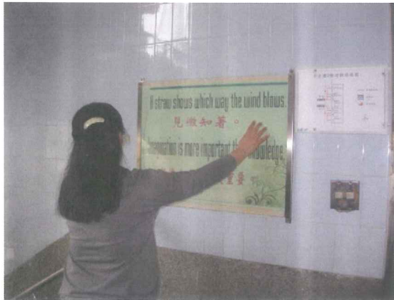
說明:實地勘查校園雙語標示(1)