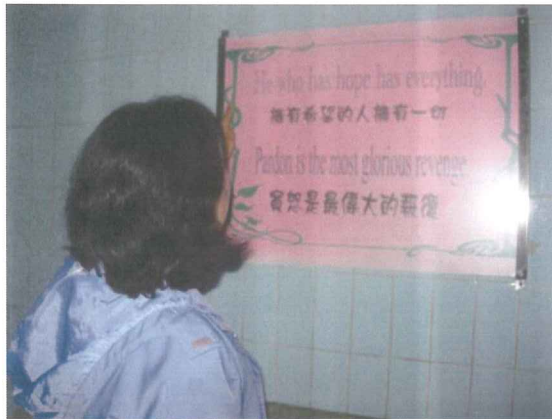
說明:實地勘查校園雙語標示(3)