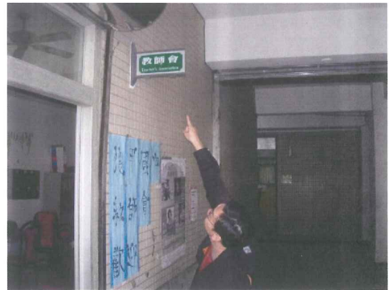
說明:實地勘查校園雙語標示(2)