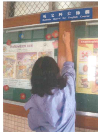
說明:實地勘查校園雙語標示(4)