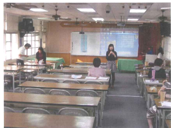
說明:討論校園雙語標示(2)